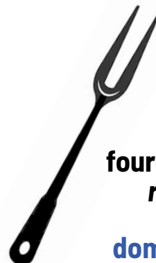
fourche à rôti roasting fork