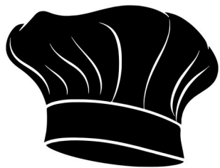
toque de chef-fe chef's hat